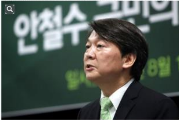
▲ 광주 광운대 안철수 기자간담회 국민의당 안철수 전 대표 후보가 10일 오후 광주 서구 지평동 광주시의회 브리핑룸에서 기자간담회를 하고 있다. 2017.08.10

공도전을 선언한 안철수 전 대표가 10일 "더불어민주당과 대결할 때 정동영 대 미애, 천정배 대 추미애, 안철수 대 추미애, 과연 어떤 구도가 한명이라도 많은 기 초의원을 당선시킬지 그 기준 하에서 판단해야 한다"며 지지를 호소했다.